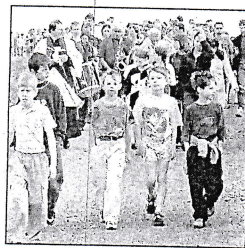
V průvodu ze vsi ke kříži šlo přes sto lidí.