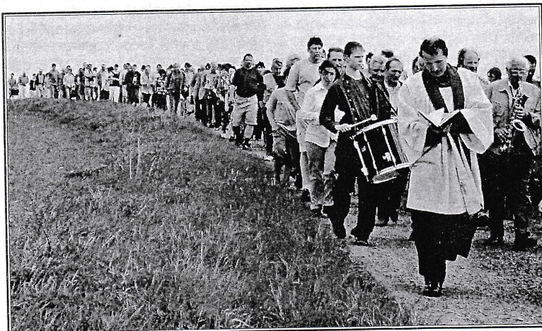
Svěcení nového kříže ve Skřivani si nenechala ujít více než stovka lidí.