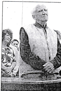
Lidé zaujatě naslouchali faráři vyprávění o historii a významu smírčího kříže.