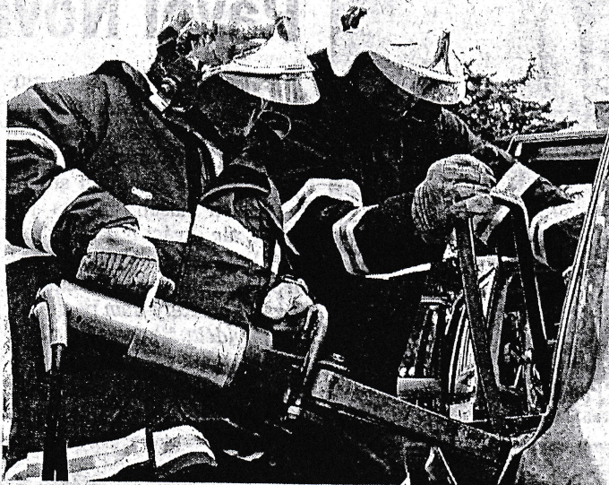
Profesionální záchranáři z Rakovníka předvedli s pomocí speciální techniky vyproštění lidí z havarovaného auta.