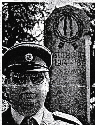
První zastávkou průvodu byl pomník padlých hrdinů. K němu hasiči položili květy a drželi u něj čestnou stráž.