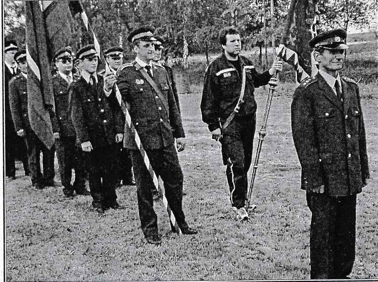
Slavnostní defilé na skřivaňském hřišti. Ač bez ohně, proběhly oslavy 110 let trvání Sboru dobrovolných hasičů Skřiván za velkého zájmu veřejnosti a k plné spokojenosti pořadatelů.