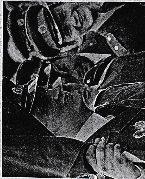
Seřazení skřivanští hasiči čekají před zdejší pohostinstvím, aby se za okamžik vydali v doprovodu více než dvou stovek lidí na slavnostní průvod obcí.